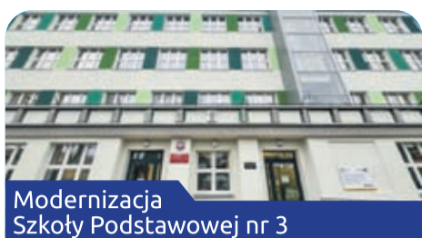
Modernizacja Szkoły Podstawowej nr 3