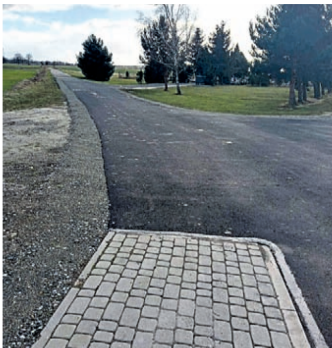
Nakładka asfaltowa w Rzeczycy, dojazd do cmentarza