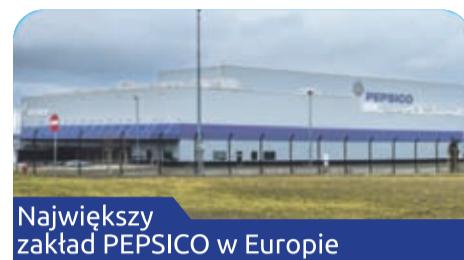
Największy zakład PEPSCO w Europie