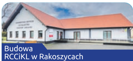
Budowa RCCiKL w Rakoszycach