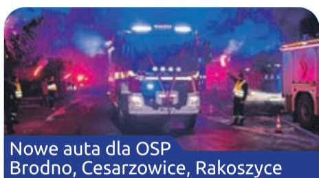
Nowe auta dla OSP Brodno, Cesarzowice, Rakoszyce