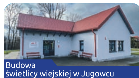
Budowa świetlicy wiejskiej w Jugowcu