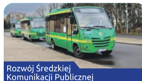
Rozwój Średzkiej Komunikacji Publicznej