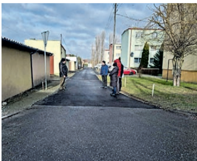
Nakładka asfaltowa na osiedlu Spółdzielni Mieszkaniowej Na Skarpie w Ciechowie