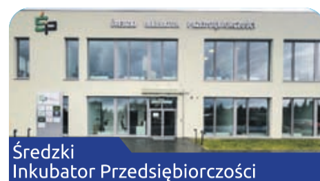
Średzki Inkubator Przedsiębiorczości