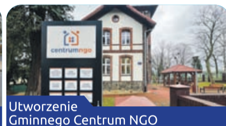
Utworzenie Gminnego Centrum NGO