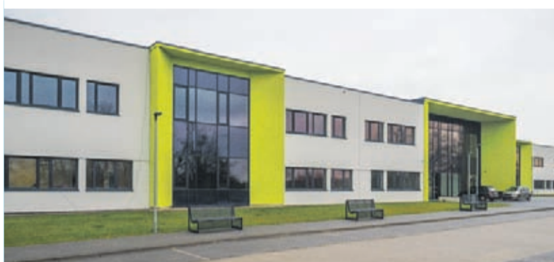
Nowa Szkoła Podstawowa na Winnej Górze w Środzie Śląskiej