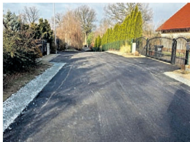
Nakładka asfaltowa w Brodnie, zejście do stawu