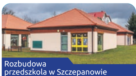
Rozbudowa przedszkola w Szczepanowie