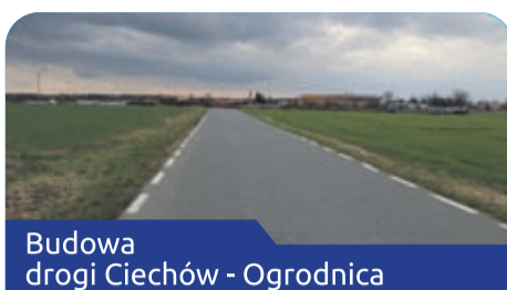
Budowa drogi Ciechów - Ogrodnica