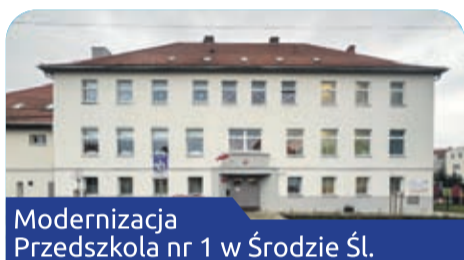
Modernizacja Przedszkola nr 1 w Środzie Śl.