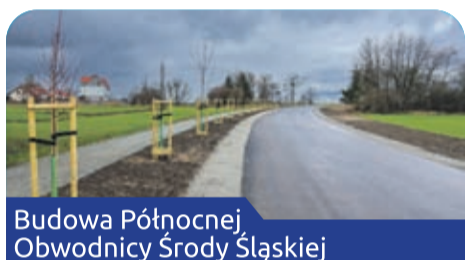
Budowa Północnej Obwodnicy Środy Śląskiej