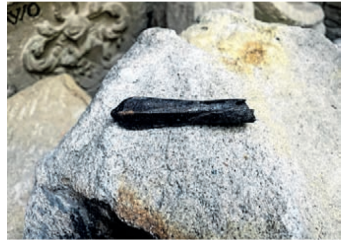
Grot bełtu kuszy ze zbiorów Muzeum Regionalnego w Środzie Śląskiej.

Dzisiaj chcielibyśmy przedstawić Państwu zabytek archeologiczny, który niedawno zasilili nasze muzealne zbiory. Jest to grot bełtu kuszy datowany na XII – XV w., który został znaleziony w pobliżu średzkich murów miejskich (po ich zewnętrznej stronie). Zabytek na pierwszy rzut oka może i niepozorny, jednak zapewne pamiętający niejedno dramatyczne wydarzenie.