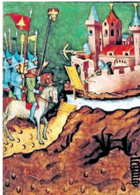
Bitwa pod Legnicą na tryptyku św. Jadwigi z kościoła Bernardynów we Wrocławiu.

Śląsk wiosną 1428 roku? Niestety, na dzień dzisiejszy nie możemy mieć takiej pewności, chociaż wyobraźnia