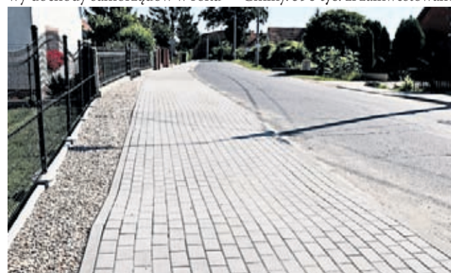
Nowy chodnik przy drodze powiatowej w Jastrzębcach

Na początku sierpnia został zakończony i odebrany nowy chodnik przy drodze powiatowej w Jastrzębcach. To inwestycja między kadencyjna, gdzie umowę z wykonawcą podpisałem 2 maja br. jeszcze w imieniu Gminy. 390 tys. zł zainwestowane