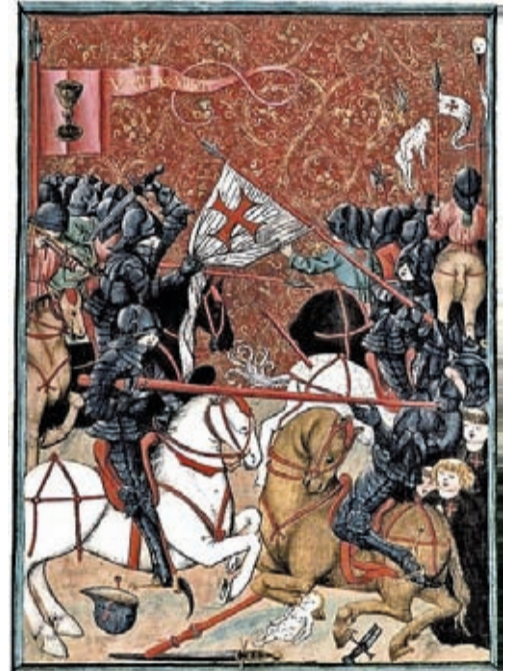
Wojny husyckie przedstawione w średniowiecznym, czeskim manuskrypcie Jenický kodeks.

Kusze były niezwykle niebezpieczną bronią, powszechnie stosowaną w średniowiecznej Europie. Wystrzeliwane z nich bełty potrafiły osiągać znaczące