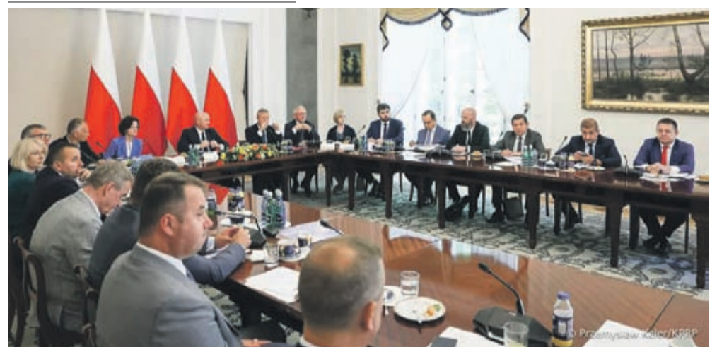
Posiedzenie Rady ds. Samorządu Terytorialnego NRR w Warszawie

Zgodnie z moją deklaracją jako radnego Rady Powiatu z okręgu Miasta i Gminy Środa Śląska, przekazuję Państwu najważniejsze informacje o podejmowanych przeze mnie działaniach i inicjatywach oraz kluczowych sprawach dla Mieszkańców Powiatu. Dziś kilka informacji z ostatnich tygodni.