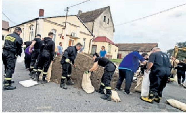
OSP Cesarzowice Opatrzności Ochotnicza Straż Pożarna w Rakoszycah OSP BUKÓWEK/OSP CESARZOWICE