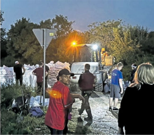
Oddział średzki pomagał w wielu miejscowościach w powiecie średzkim. Na zdjęciach prezentujemy sytuację w Malczycach i Brzezince Średzkiej (gmina Miękinia). Stowarzyszenie Projekt 71