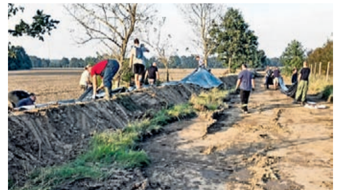
Budowa wałka ziemnego Lipnica-Brodno

inicjatorów i wszystkich zaangażowanych mieszkańców.