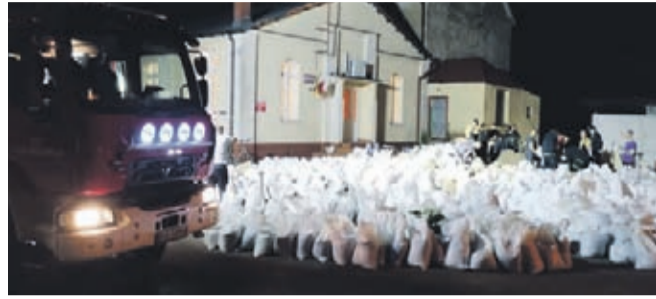
Dzisiaj od rana trwa układanie worków na wale Średzkiej Wody.

Do późnych godzin wieczornych strażacy OSP Bukówek uczestniczyli wraz ze strażakami z pozostałych jednostek OSP z terenu Miasta i Gminy Środa Śląska w napełnianiu worków piaskiem w miejscowości Rzeczyca.