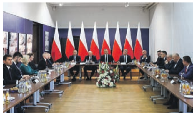
Posiedzenie Rady ds. Samorządu Terytorialnego w Wieluniu z udziałem Prezydenta RP

Zgodnie z moją deklaracją jako radnego Rady Powiatu przekazuję Państwu najważniejsze informacje o podejmowanych działaniach i inicjatywach oraz kluczowych sprawach dla Mieszkańców Powiatu. Dziś kilka informacji z ostatnich kilkunastu dni.